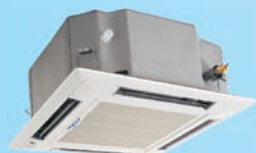
FSK-360B H 10,0 kW F 11,0 kW