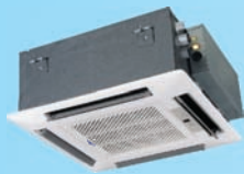
FSK-180B-EU H 5,0 kW F 5,4 kW