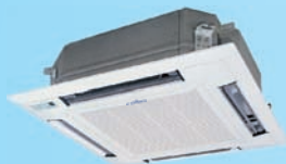
FSK-240B H 6,8 kW F 7,5 kW